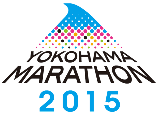
横浜マラソン・ロゴ制作 発注者：横浜マラソン組織委員会 クリエイター：満島弘+山下良平