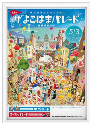
ザよこはまパレード ポスターデザイン制作 発注者：国際仮装行列実行委員会 クリエイター：株式会社 hush