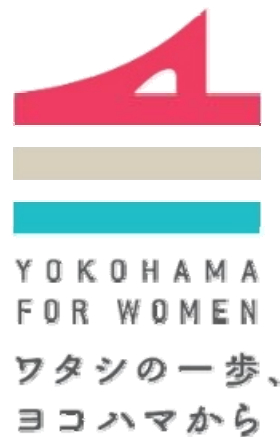
「女性の活躍推進」施策 ロゴ制作 発注者：横浜市政策局 クリエイター：相澤事務所