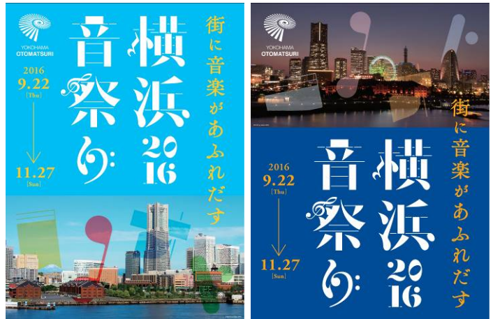
横浜音祭り 2016 ビジュアル制作 発注者：横浜アーツフェスティバル実行委員会 クリエイター：株式会社ボイズ