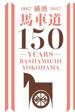
馬車道 150 周年記念ロゴ制作 発注者：馬車道商店街協同組合 クリエイター：有限会社天野和俊デザイン事務所