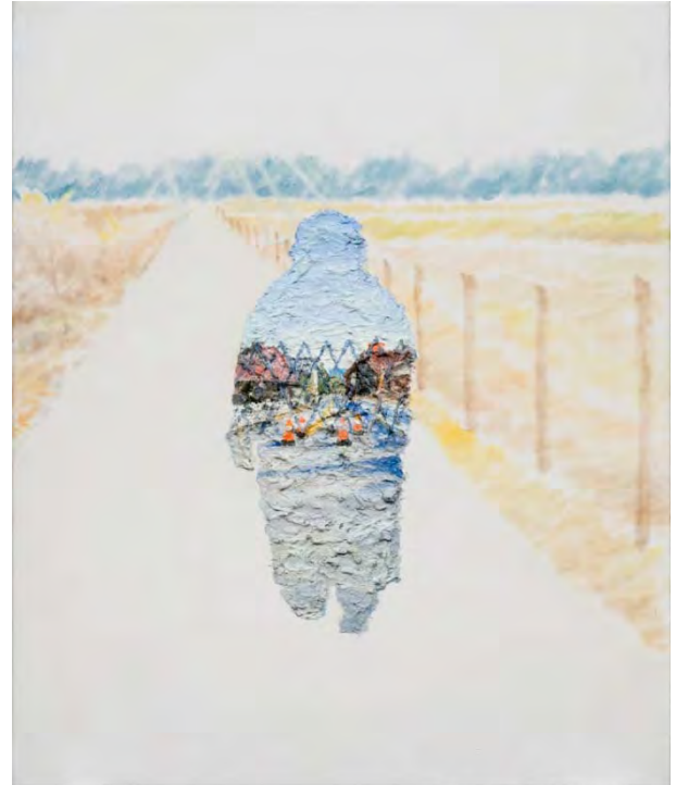
加茂昂/風景と肖像のあいだ1 2017年/油彩、キャンバス/45.5×38.0cm/個人蔵

キャンバスという四角いフィールドに表現された個々のリアリティは、どのように積み重なり、わたしたち鑑賞者や現実の世界と接続しているのでしょうか。大型絵画やドローイングを中心に、約30点の新作を含む100点の絵画から読み解いてみたいと思います。