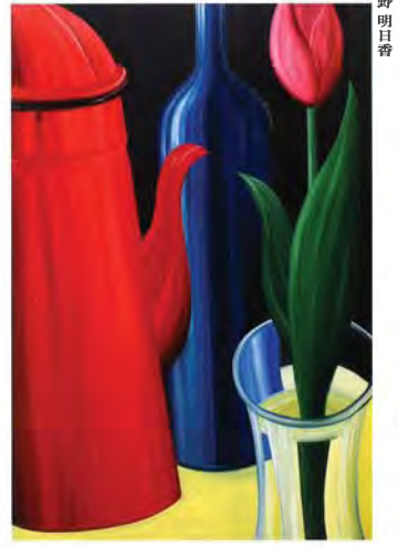
横野明目香/2015/油彩、キャンバス/194×130cm

Yamaoka Toshiaki [Lives and Works in Osaka] Born in Osaka in 1972. Yamaoka Toshiaki graduated from Tokyo Zokei University in 1998. He temporarily names the age-regression of the forms, which have a kind of suggestive structure, as "GUTIC", and continues to obsessively search for such forms as "the possibility that may have existed" in the real world. Selected recent solo exhibitions include: "STREET GUTIC STUDIO" (STREET GALLERY, Hyogo, 2019), "GUTIC i was born" (Gallery PARC, Kyoto, 2017) and "GUTIC STUDY" (GALLERY HOSHINO, Tokyo, 2011). Selected group exhibitions include: "10th ART PROGRAM OME" (BOX KI-O-KU, Tokyo, 2012) and "Mirage" (Doshisha University, Kyoto, 2009).