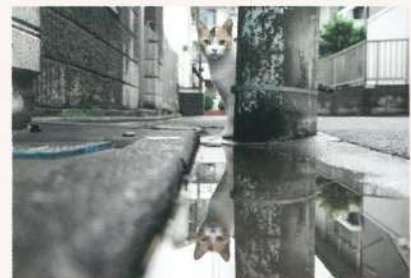
ひょっこりももちゃん (@Lemolatte)