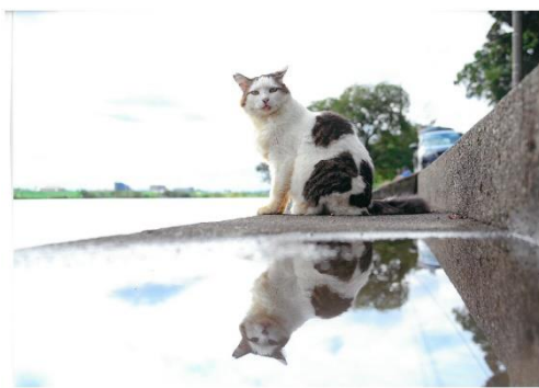
台風一過 俺、無事です(キリッ!)(@Lemolatte)