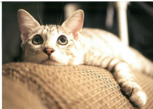
だらーん…次は何して遊ぼっかなあ(ebitorakage)