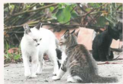
みあってみあって、はっけよ〜い (@たぬきねこ2)