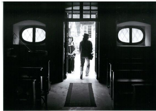
ねこの目協会 I N. クロアチア(直)