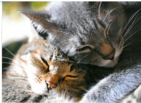
一緒にいいね。心も身体も暖かいから。(ゆずなつ)

【前回の力作を一部ご紹介】(ねこ写真展2020の応募作品は9月6日(日)までロビーで展示中です)