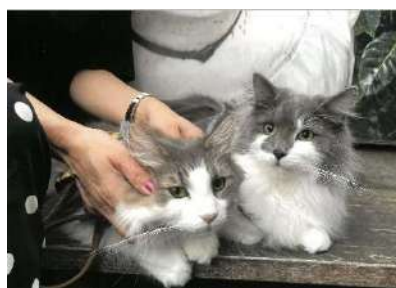
スタバでくつろぐ ノルウェージャン兄弟(子猫のリチャード)