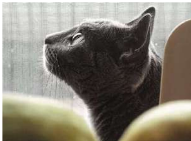
君の瞳に恋してる♡(チェダー)