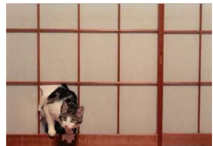
障子の中の猫(ぬかるみ)