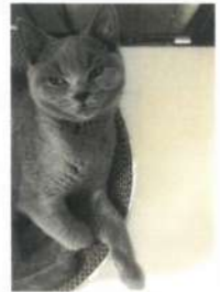
2022年 子ども部門より「子ども作品賞」(5点)