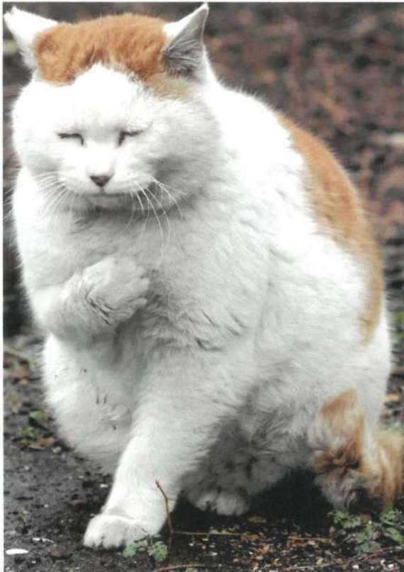
2022年一番人気賞 イエス、マイ・ロード(けにち)

会場内とWEBで実施する人気投票と審査で各賞を決定、入賞者には賞品をプレゼント！