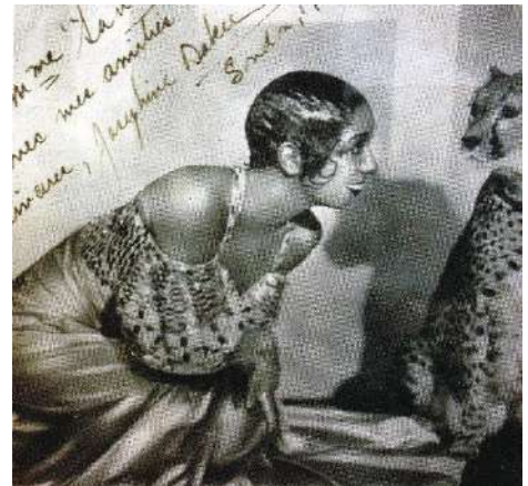
ダンサー、歌手として世界的に活躍したジョセフィン・ベイカー

ジョセフィン・ベイカーは、大磯町のエリザベス・サンダース・ホーム園長だった澤田美喜と親交を深めていた。写真はジョセフィンが澤田に贈ったものと、推察される。