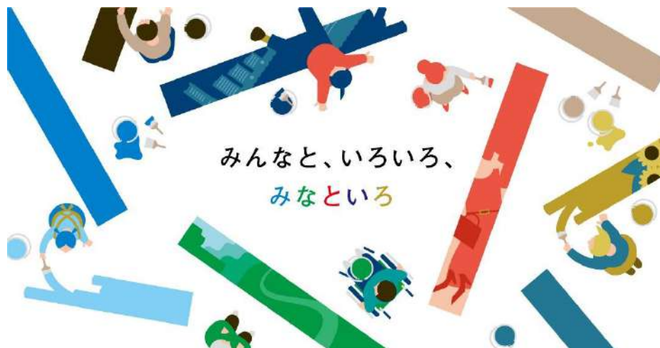
仮囲い掲載イメージ