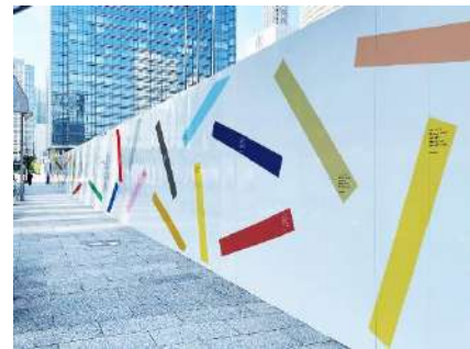
仮囲い掲載イメージ