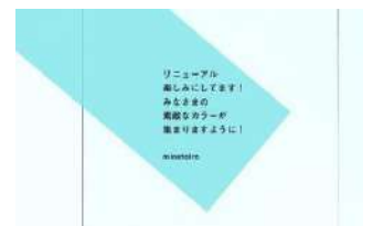
メッセージ掲載イメージ(部分)