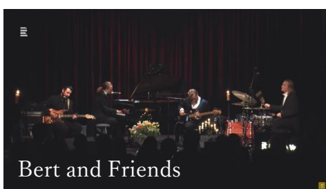
Bert and Friends